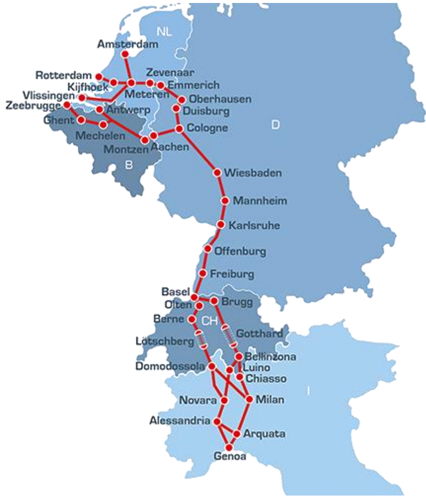
1. Corridoi Europei ferroviari per le merci (sopra) – 2. Il corridoio Reno-Alpi (sotto)