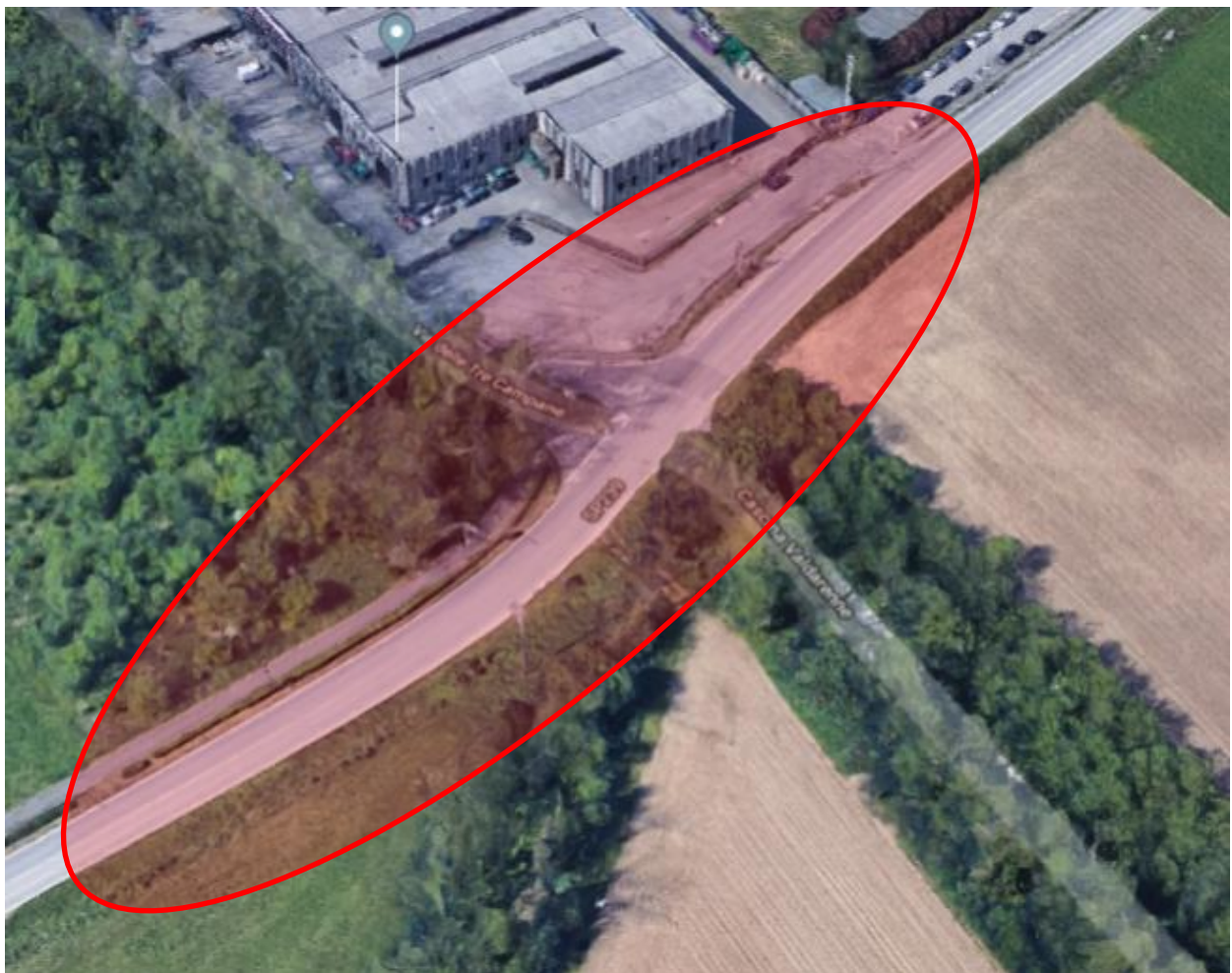
Vista aerea della zona dell'incrocio in oggetto con indicata in rosso l'area di intervento